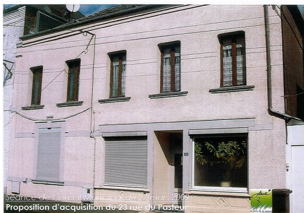
Séance de Conseil Municipal du 27 mars 2009 Proposition d'acquisition du 23 rue du Pasteur

de créer un cabinet double desservi par une salle d'attente centrale. Par ailleurs, dans la partie inexploitée, les services techniques vont pouvoir créer un petit appartement qui pourrait servir à loger un médecin.