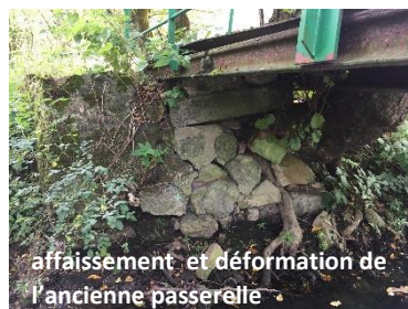
affaissement et déformation de l'ancienne passerelle

Contacté par l'association pour la défense des chemins ruraux des Hauts-de-France en juin 2017 pour effectuer le recensement des chemins ruraux avec les communes volontaires, Anor a répondu positivement et très rapidement pour que ce dernier puisse s'effectuer. Grâce à ce travail, une première opération concrète a pu être programmée sur l'un des 54 chemins recensés et notamment sur le n°24 dit Chemin de la Vieille Verrerie . En effet, l'ancienne passerelle , surplombant le ruisseau des Anorelles et permettant de passer d'une rive à l'autre, présentait de nombreux signes de vétusté et justifiait donc une intervention afin d'assurer les meilleures conditions de sécurité notamment aux promeneurs empruntant ce chemin.