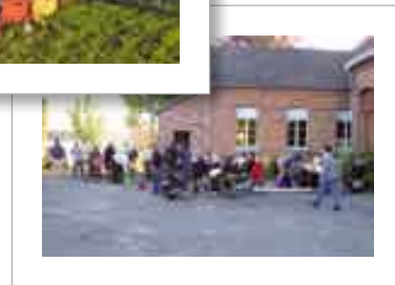
Point du Jour