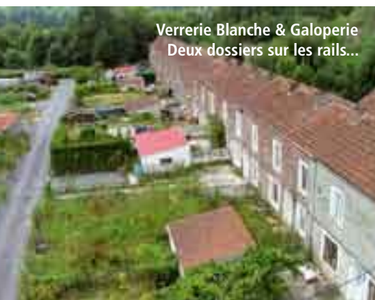
Verrerie Blanche & Galoperie Deux dossiers sur les rails...