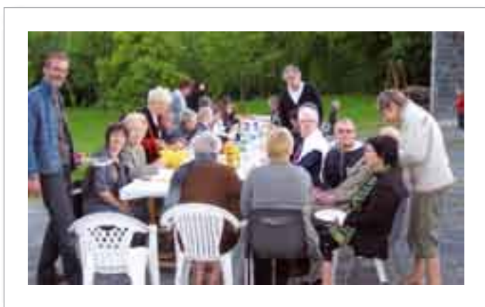
Rue du Camp de Giblou