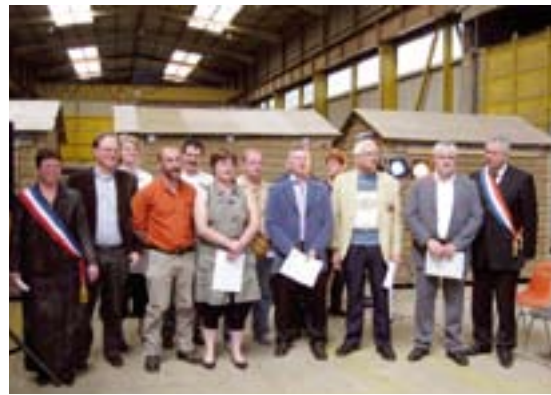
Les médaillés du travail

Après le défilé, Madame le Maire a remis à 13 anoriens, le diplôme de la Médaille du travail pour les années de service effectuées au sein de leur entreprise.