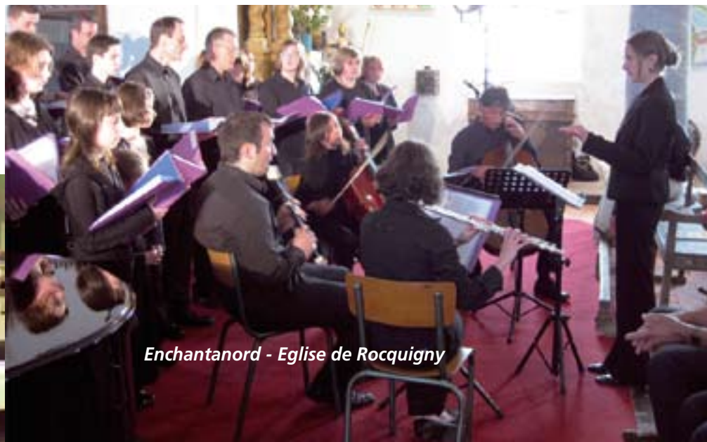
Enchantanord - Eglise de Rocquigny