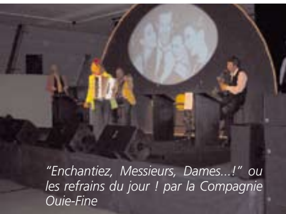
"Enchantiez, Messieurs, Dames...!" ou les refrains du jour ! par la Compagnie Ouïe-Fine