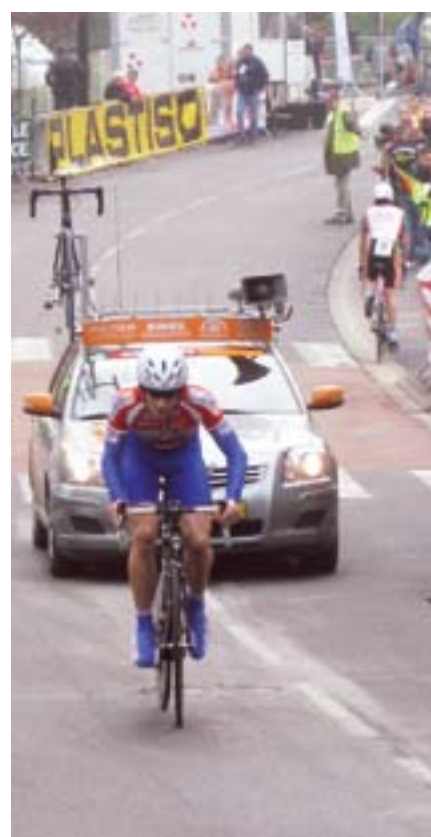
Les Boucles Cyclistes du Canton de Trélon