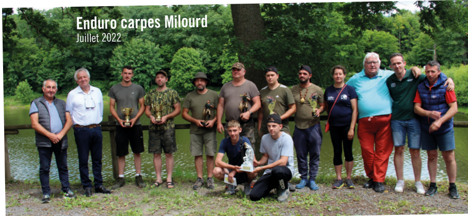
Enduro carpes Milourd Juillet 2022