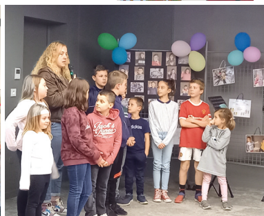
▲ Exposition sur les droits de l'enfant