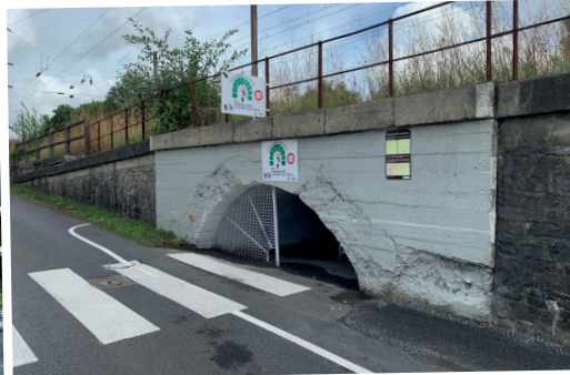
Remise en service du passage piéton de la « tête baissée »