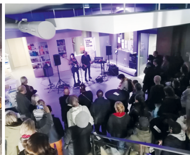
▲ Soirée concert