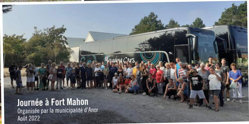
Journée à Fort Mahon Organisée par la municipalité d'Anor Août 2022