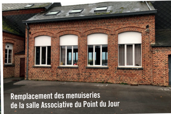
Remplacement des menuiseries de la salle Associative du Point du Jour