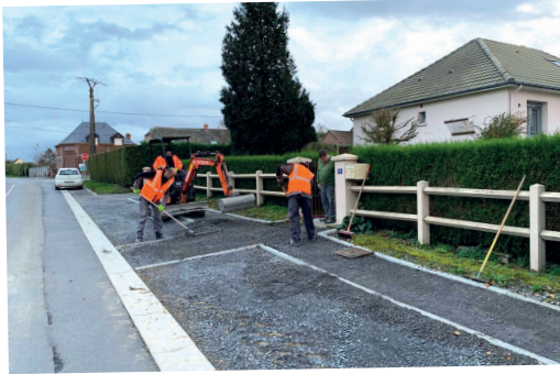
Création d'un chemin piéton et de places de stationnement au niveau de la Rue du Revin