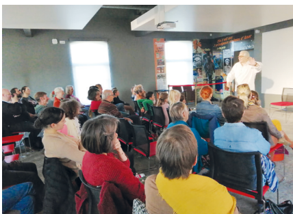
▲ Festival du conte avec des soirées « tout public »

l'association a pour but de soutenir les familles dans leur fonction parentale en favorisant les échanges entre parents, travailler sur la problématique de l'isolement des parents (contact.apartentiere@gmail.com)