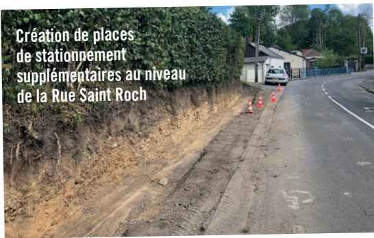
Création de places de stationnement supplémentaires au niveau de la Rue Saint Roch