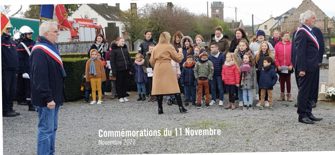
Commémorations du 11 Novembre Novembre 2022