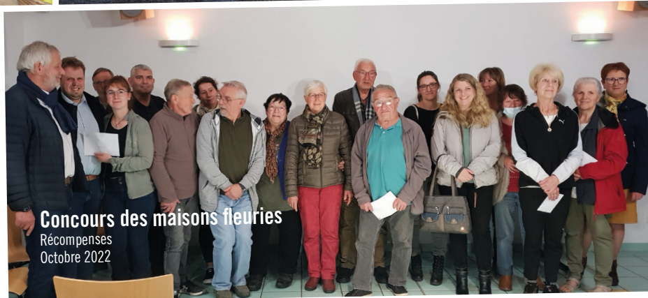
Concours des maisons fleuries Récompenses Octobre 2022