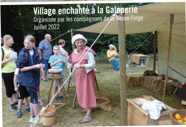
Village enchanté à la Galopierie Organisée par les compagnons de la Neuve Forge Juillet 2022