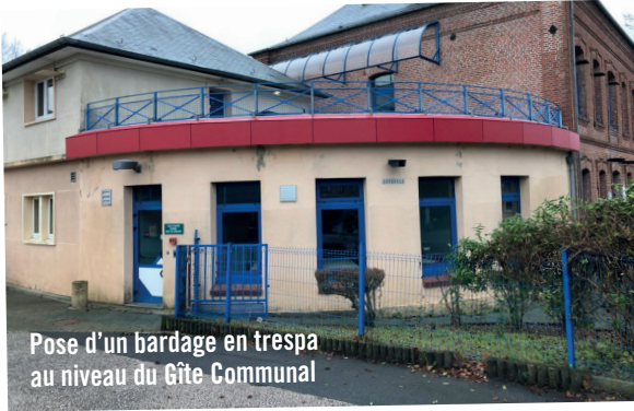
Pose d'un bardage en tresspa au niveau du Gîte Communal