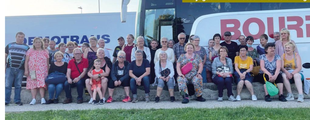
Voyage à la mer 24 août 2023 - Berck Plage