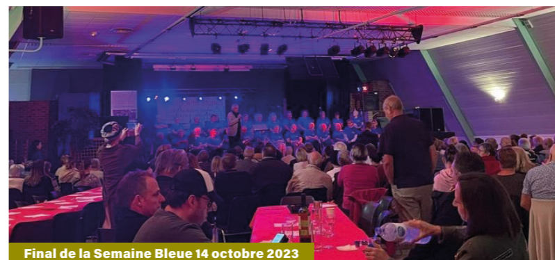
Final de la Semaine Bleue 14 octobre 2023