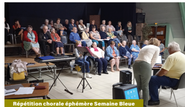
Répétition chorale éphémère Semaine Bleue