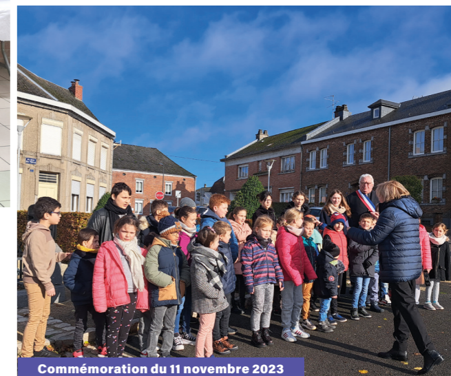
Commémoration du 11 novembre 2023