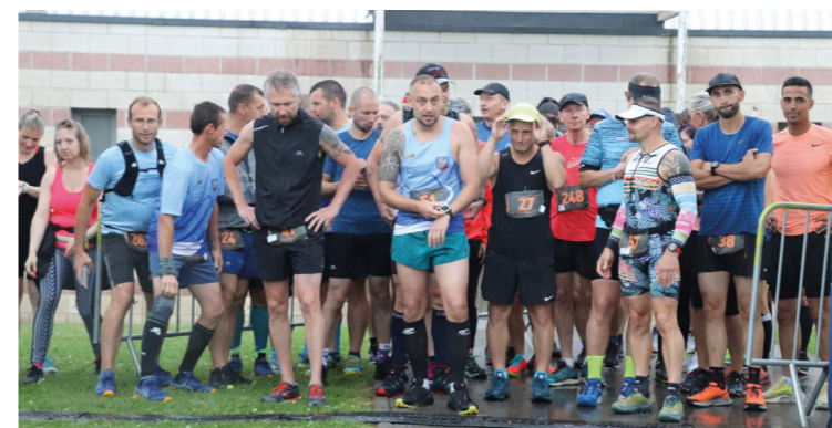
La givree anorienne organisée par l'Association Esprit trail 25 octobre 2023