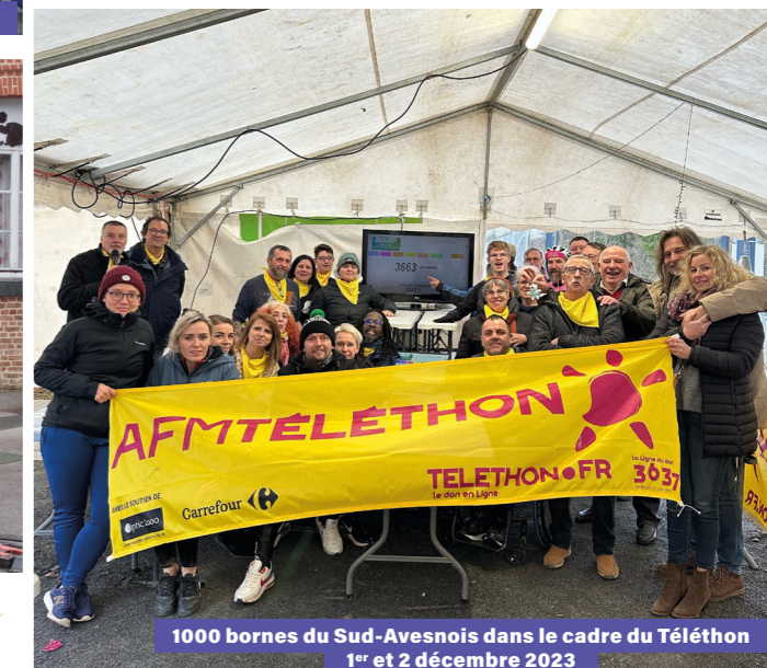
1000 bornes du Sud-Avesnois dans le cadre du Téléthon 1 er et 2 décembre 2023