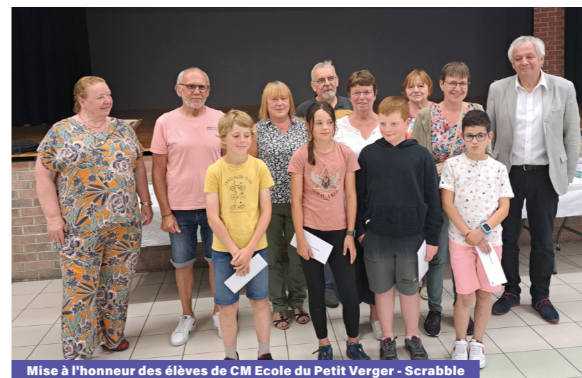
Mise à l'honneur des élèves de CM Ecole du Petit Verger - Scrabble