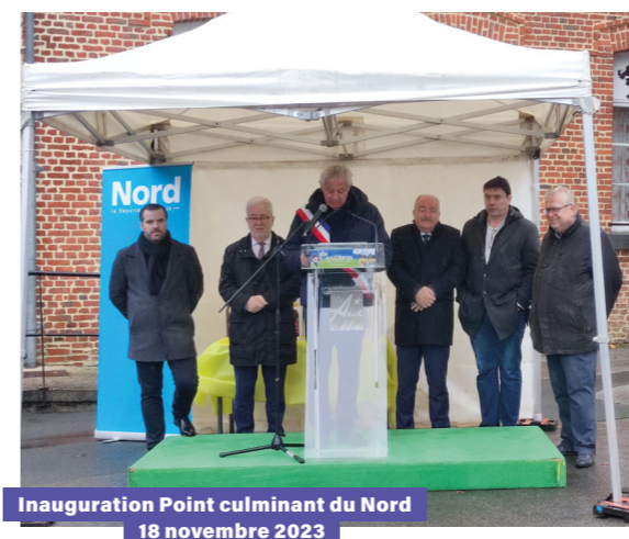
Inauguration Point culminant du Nord 18 novembre 2023