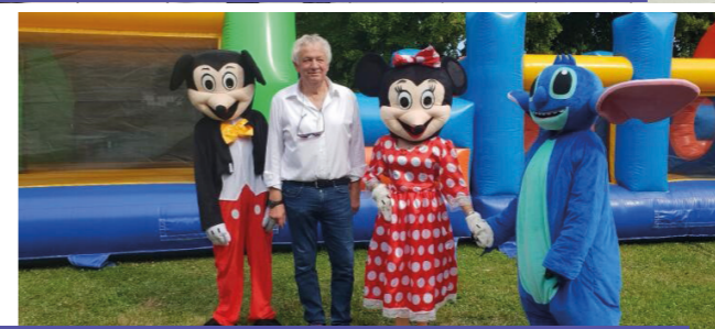
Anor Plage et les mascottes de l'Association Fashion Dance - Août 2023