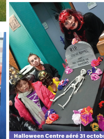
Halloween Centre aéré 31 octobre 2023